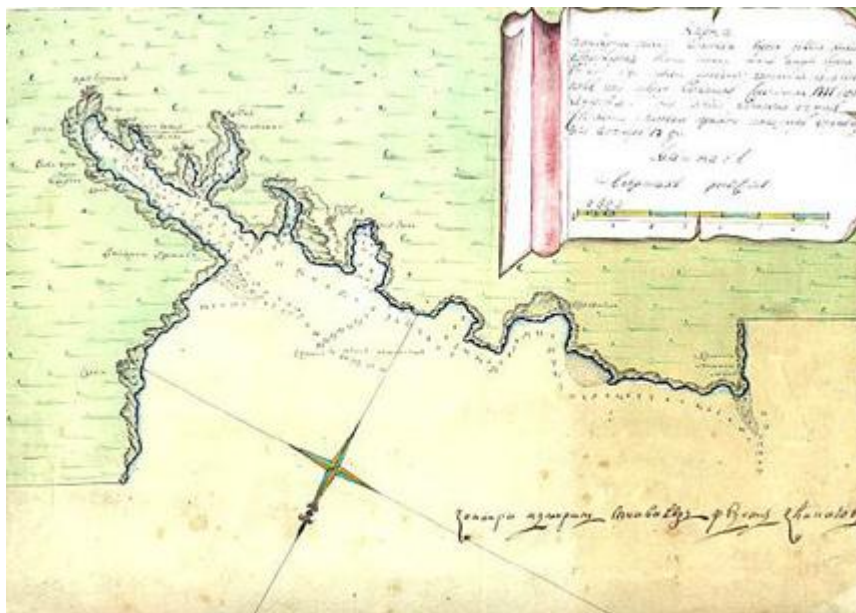
Карта Ахтиарской (Севастопольской) бухты 1777 г.

А.В. Суворов по достоинству оценил качества бухты: «...подобной гавани не только у здешнего полуострова, но и на всем Черном море не найдется, где бы флот лучше сохранен и служащие на оном удобнее и спокойнее помещены быть могли».